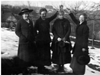
Um 1916: Studentinnen "krönen" eine Kommilitonin nach bestandenen Prüfungen.

Im Wintersemester 1908 haben 50 Frauen an den Universitäten Marburg, Gießen und Darmstadt ihr Studium begonnen. Gegen viel Widerstand setzten sie durch, dass die Universitäten auch Frauen offen stehen.