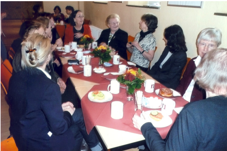
Gemütliches Beisammensein im Milchkeller der Schule