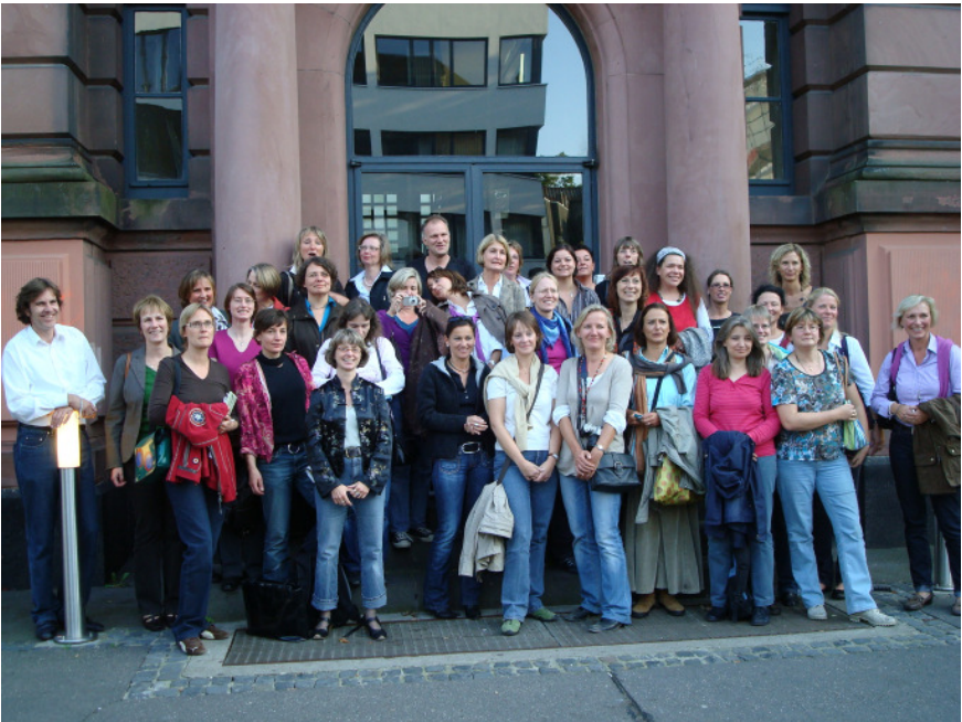
Der Abiturjahrgang 1984 vor dem Schulportal.