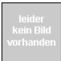
Liebig, Bärbel , Studienrätin Englisch, Erdkunde Ruhestand, Juli 2001